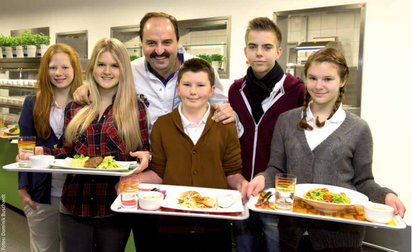
TV-Koch Johann Lafer kocht für Schülerinnen und Schüler des Gymnasiums Römerkastell gesundes Essen.

teuren Mensa miteinbezogen. Das war ganz wichtig.“