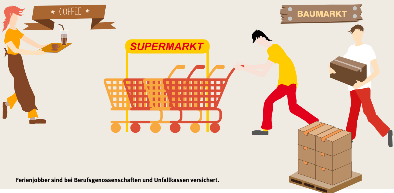
Ferienjobber sind bei Berufsgenossenschaften und Unfallkassen versichert.

In aller Regel liegen Schülerpraktika im organisatorischen Verantwortungsbereich der Schule, die gemäß dem einschlägigen Schulrecht Einfluss auf Inhalt und Form des Praktikums nimmt und die Schülerinnen und Schüler persönlich vor Ort betreuen muss. Gleichgültig ist dabei, ob der Schülerin oder dem Schüler eine Praktikumsstelle von der Schule zugewiesen wurde oder ob es sich um ein freiwilliges Praktikum handelt. Während dieser Betriebspraktika sind Schülerinnen und Schüler durch die