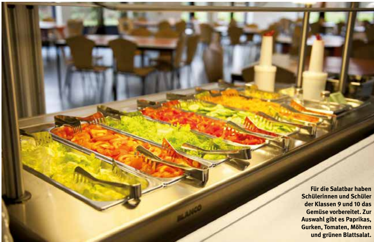
Für die Salatbar haben Schülerinnen und Schüler der Klassen 9 und 10 das Gemüse vorbereitet. Zur Auswahl gibt es Paprikas, Gurken, Tomaten, Möhren und grünen Blattsalat.

sind von dem Konzept überzeugt. Ein Großteil unterstützt uns auch finanziell über den Eltern-Förderverein“, erzählt Waterkamp weiter.